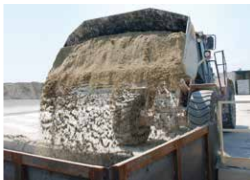
Sable – le composant principal