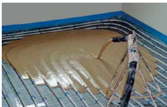
Chape de sol pompée sur un plancher chauffant