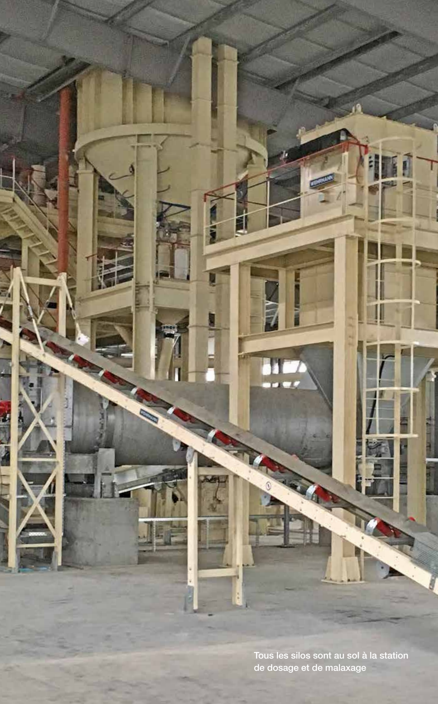
Tous les silos sont au sol à la station de dosage et de malaxage