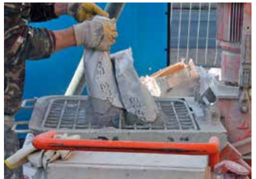
Les sacs de mortier sec sont vidés dans la cuve de la machine