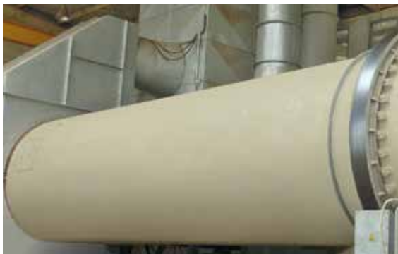
Le séchoir à sable chauffé garantit un séchage fiable

8. Le système d'installation modulaire de Wehrhahn permet de commencer la production avec une faible capacité et de procéder à une mise à niveau ultérieure. → flexibilité maximale selon des conditions du marché