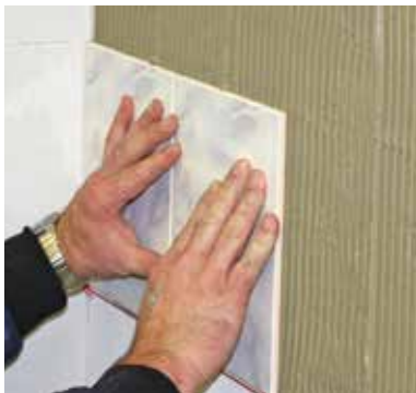
Colle parfaite pour les carreaux de mur

Pratique. Fiable. Chantier propre. Rapide. Facile.