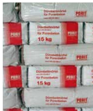
Mortier de colle BCA bien ensaché