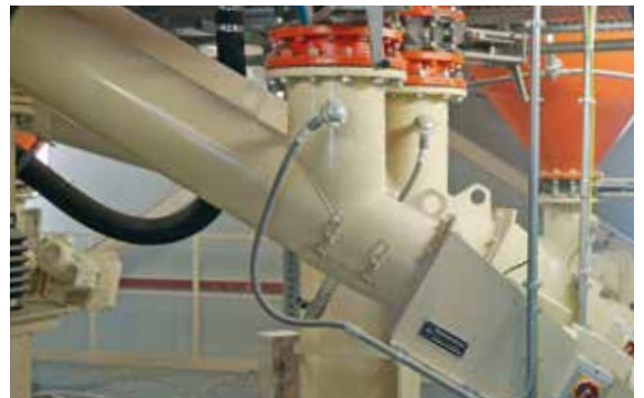
«WECOMIX», le système de dosage et de malaxage bien éprouvé de Wehrhahn, le cerveau de l'usine