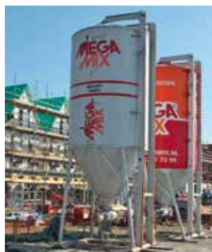
Les silos de chantier pour les grands chantiers