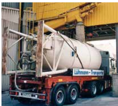
Mortier sec expédié dans des silos à site de basculement