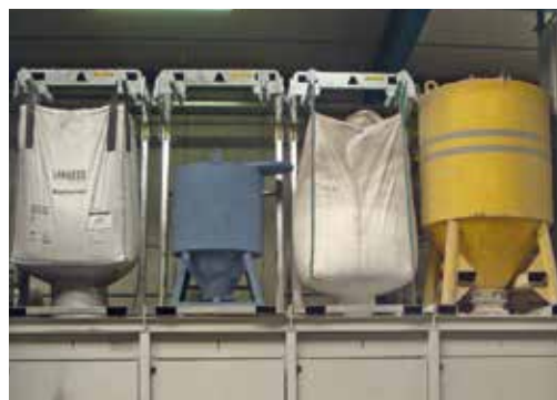
Le système de dosage de Wehrhahn permet l'ajustement de tous les additifs: directement à partir du sol avec un accès facile