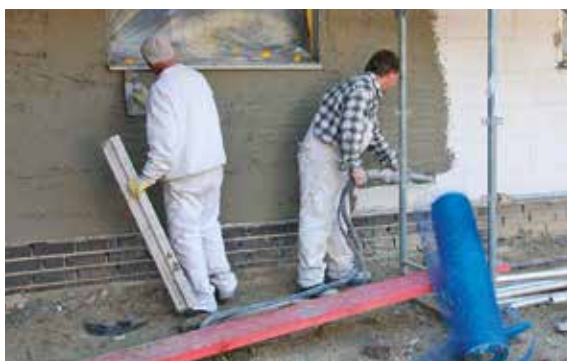
Stuc de haute qualité, la protection décorative contre les intempéries, appliqué avec une machine à enduire

améliorer l'adhérence, la maniabilité, la résistance à l'abrasion, la rétention d'eau, résistance à la flexion, résistance au gel, etc.