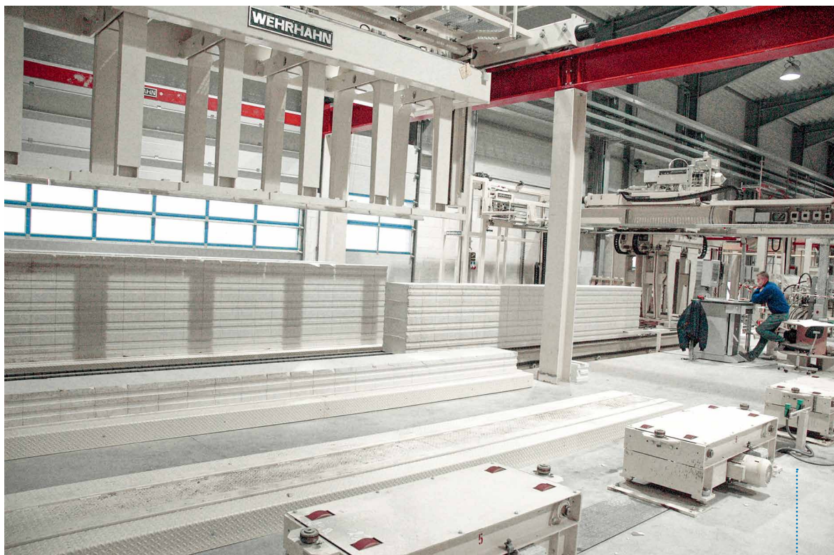
全自动生产流程：平稳的生产、一贯的产品质量、轻松的管理者