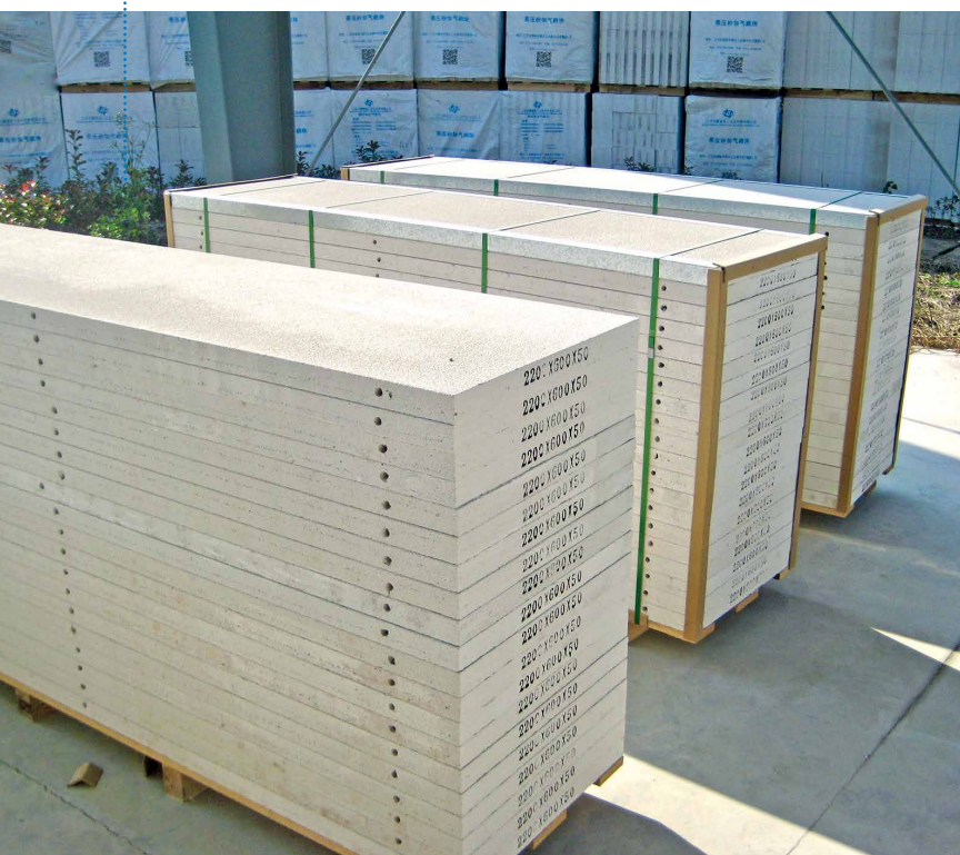
垂直墙板打开了新的市场板块—江苏宝鹏是中国国内规模首屈一指的板材生产商

某些工厂甚至决定采取“干净利落”的方案，例如 H+H Celcon 公司拆除老旧工厂并建造了全新的工厂。在此种案例中，时间是关键的因素，生产厂商通常无法承受